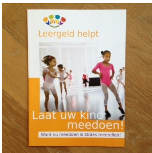
Nieuwe folder Leergeld Lelystad 2014

vormgeving aan te passen aan die van Leergeld Nederland, wat geresulteerd heeft in een mooie nieuwe folder.